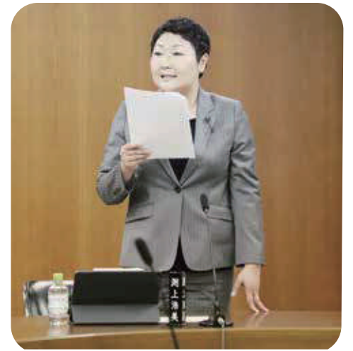
【市政改革委員会で質疑の様子】

*第1回目：令和2年7月から9月検針分。第2回目：令和4年8月から10月検針分。