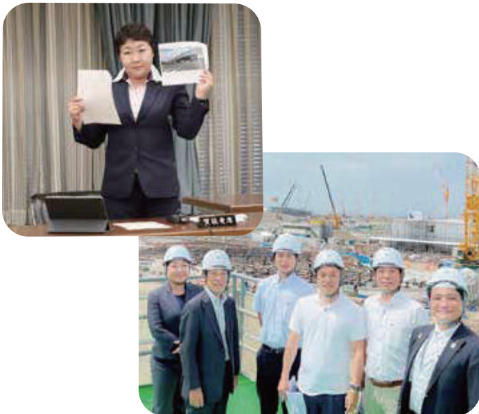
【大阪・関西万博予定地視察】